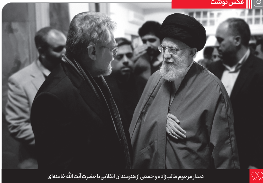
دیدار مرحوم طالب زاده و جمعی از هنرمندان انقلابی با حضرت آیت الله خامنه ای

در آن وقتی که اینها [افراد متحجر] بقیع را ویران کردند، این را بدانید؛ سراسر دنیای اسلام علیه اینها اعتراض کرد. از شرق جغرافیای اسلام - از هند - تا غرب جغرافیای اسلام، علیه اینها بسیج شدند. اینها به عنوان اینکه این کارها پرستش است، این اقدامهای خبیث را میکنند! رفتن سر قبر یک انسانی و طلب رحمت کردن برای او از خدای متعال، و طلب رحمت کردن برای خود در آن فضای معنوی و روحانی، شرک است؟ شرک این است که انسان بشود ابزار دست سیاستهای اینتلیجنس انگلیس و سی. آی. ای آمریکا و با این اعمال، دل مسلمانان را غمدار کند، آزرده کند. اینها اطاعت و عبودیت و خاکساری در مقابل طواغیت زنده را شرک نمیدانند، احترام به بزرگان را شرک میدانند! خود این، یک مصیبتی است. ● ۱۳۹۲/۲/۱۶ به مناسبت هشتم شوال، سالروز تخریب قبور ائمه بقیع علیهم السلام