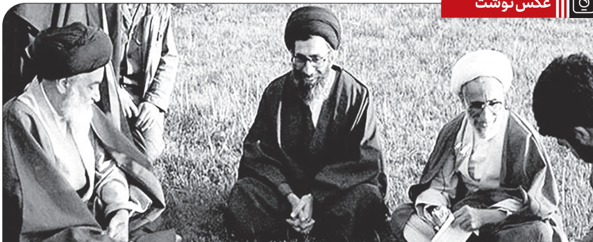
شهید آیت الله سید اسدالله مدنی در کنار آیت الله خامنه‌ای و آیت الله جنتی در بازگشت از جبهه‌های جنگ