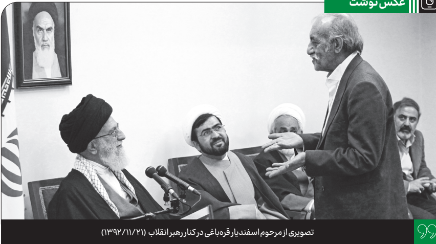
تصویری از مرحوم اسفندیار قره باغی در کنار رهبر انقلاب (۱۳۹۲/۱۱/۲۱)